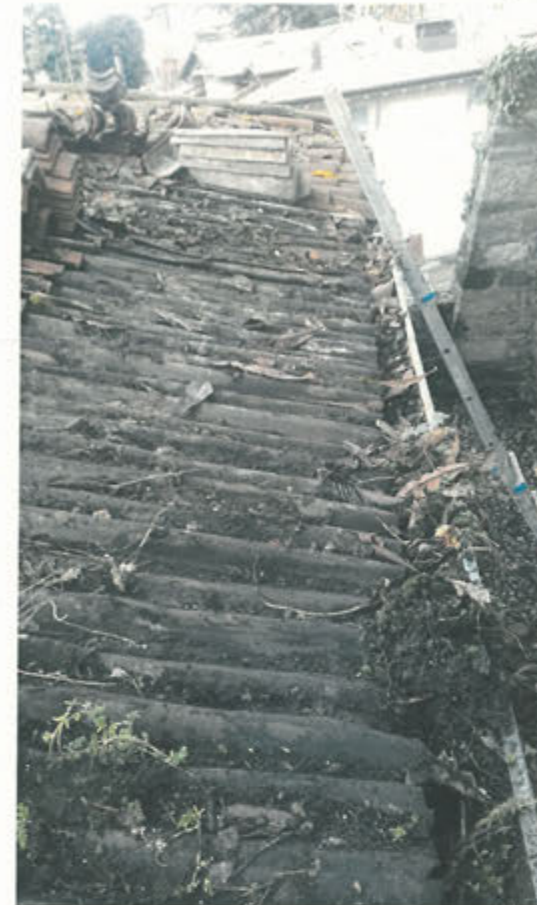
Pulizia canale di gronda