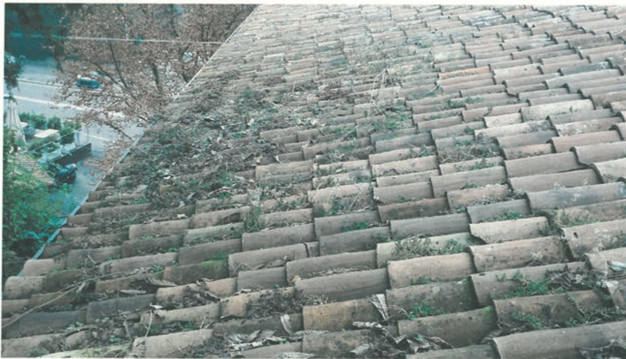
particolare copertura prima dei lavori, risulta evidente lo scivolamento dei coppi nel canale e la presenza di vegetazione che impedisce lo scolo delle acque meteoriche