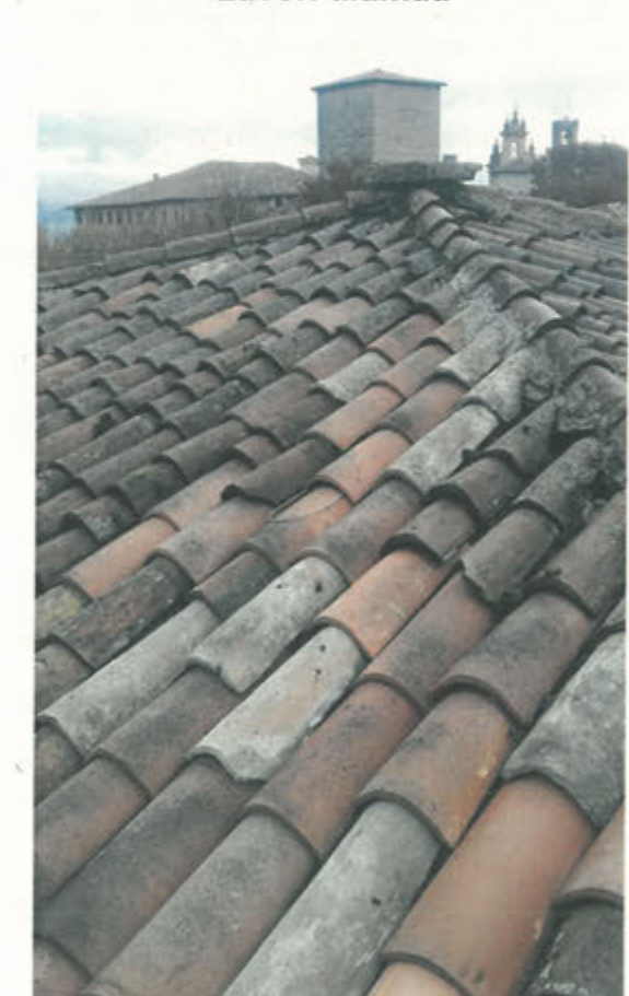
Vista del medesimo gancio a lavori ultimati, risulta quasi invisibile