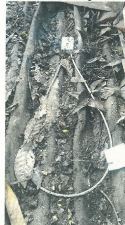
Particolare di un gancio sottocoppo, della linea vita, fissato ad un travetto