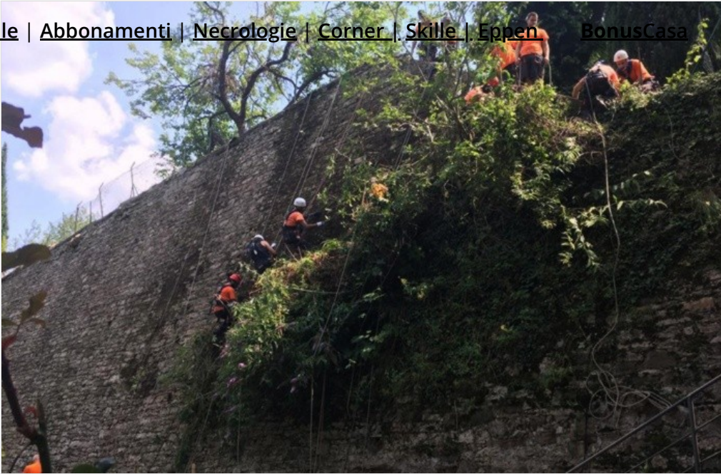
Al lavoro sul baluardo di Valverde, lo scorso ottobre