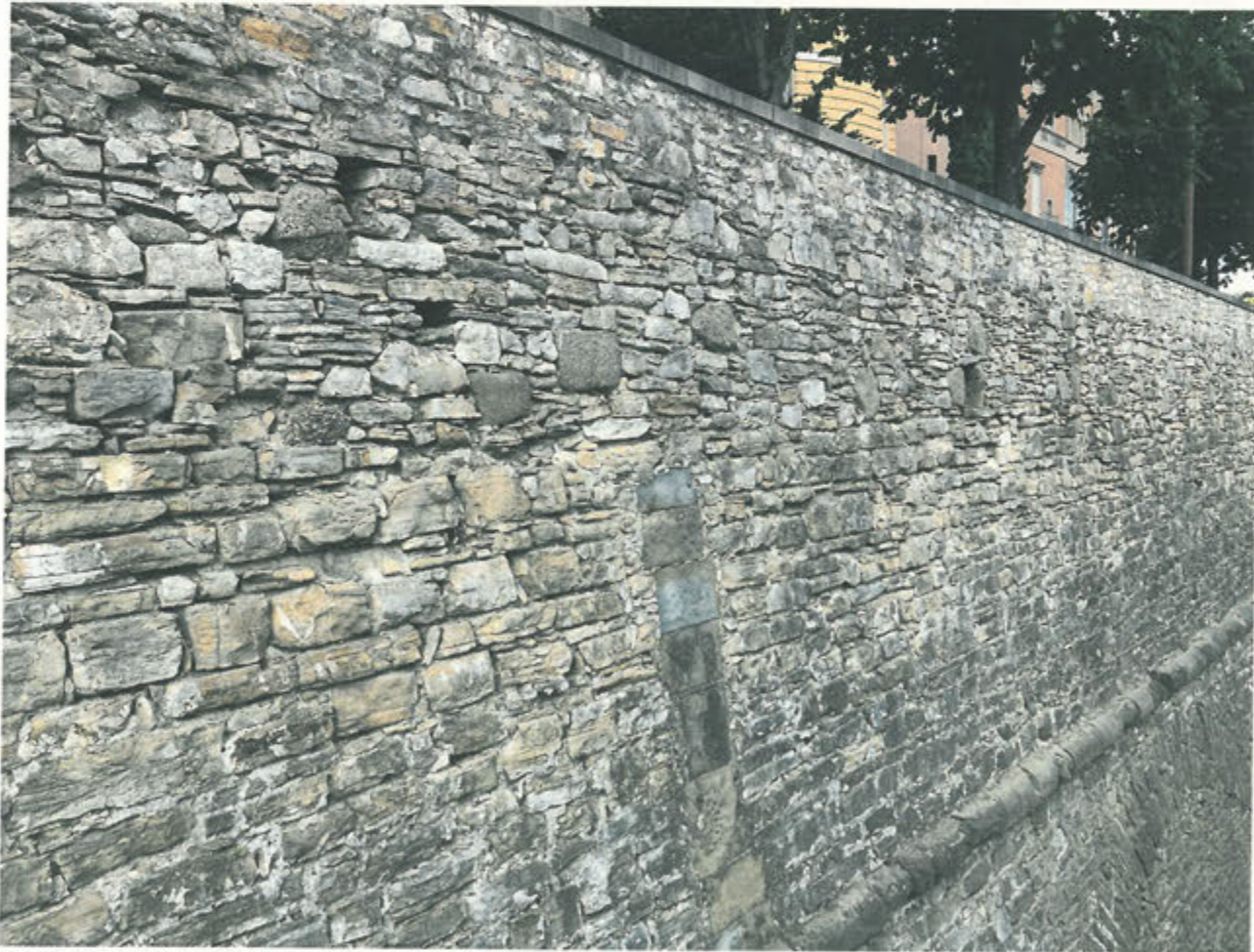
CORTINA DI S. ANDREA –particolare parte alta