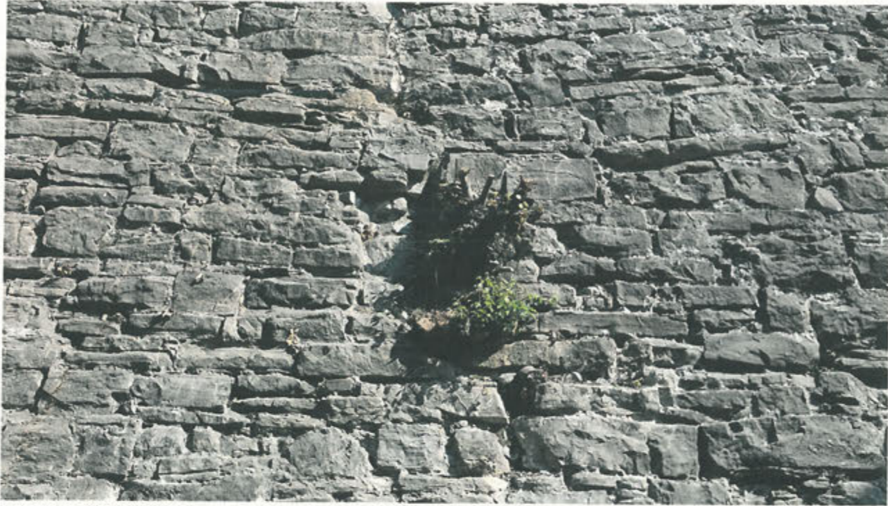
CORTINA DI S. ANDREA –apparato radicale tagliato e poi devitalizzato