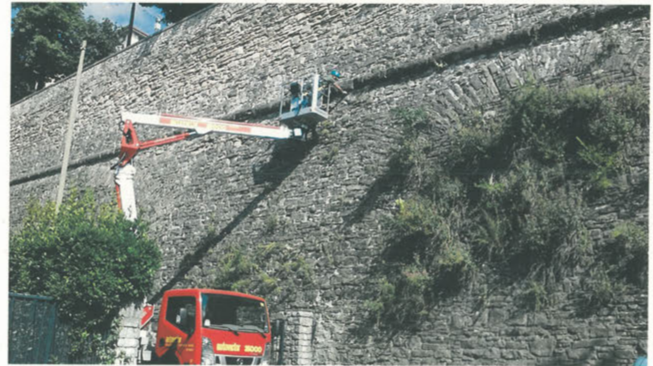
CORTINA DI S. ANDREA –ripristino localizzato sigillature