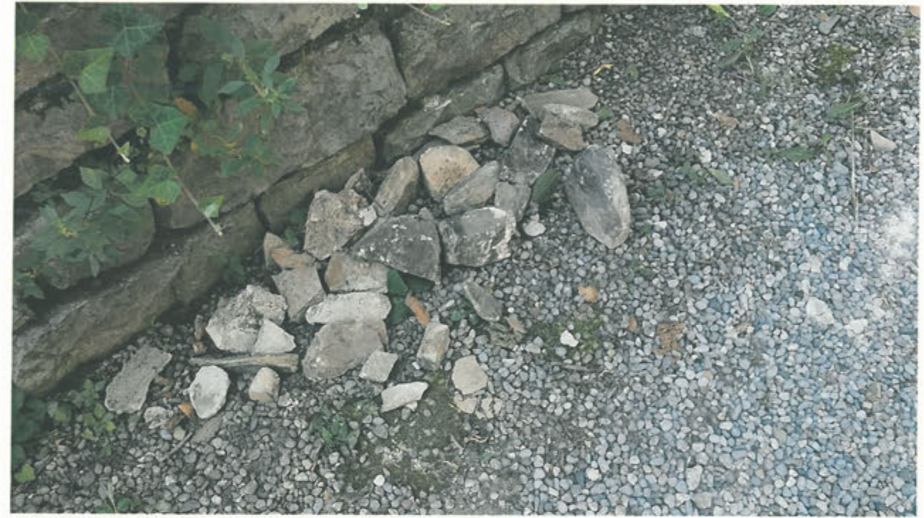
CORTINA DI S. ANDREA – conci di pietra caduti alla base e raccolti