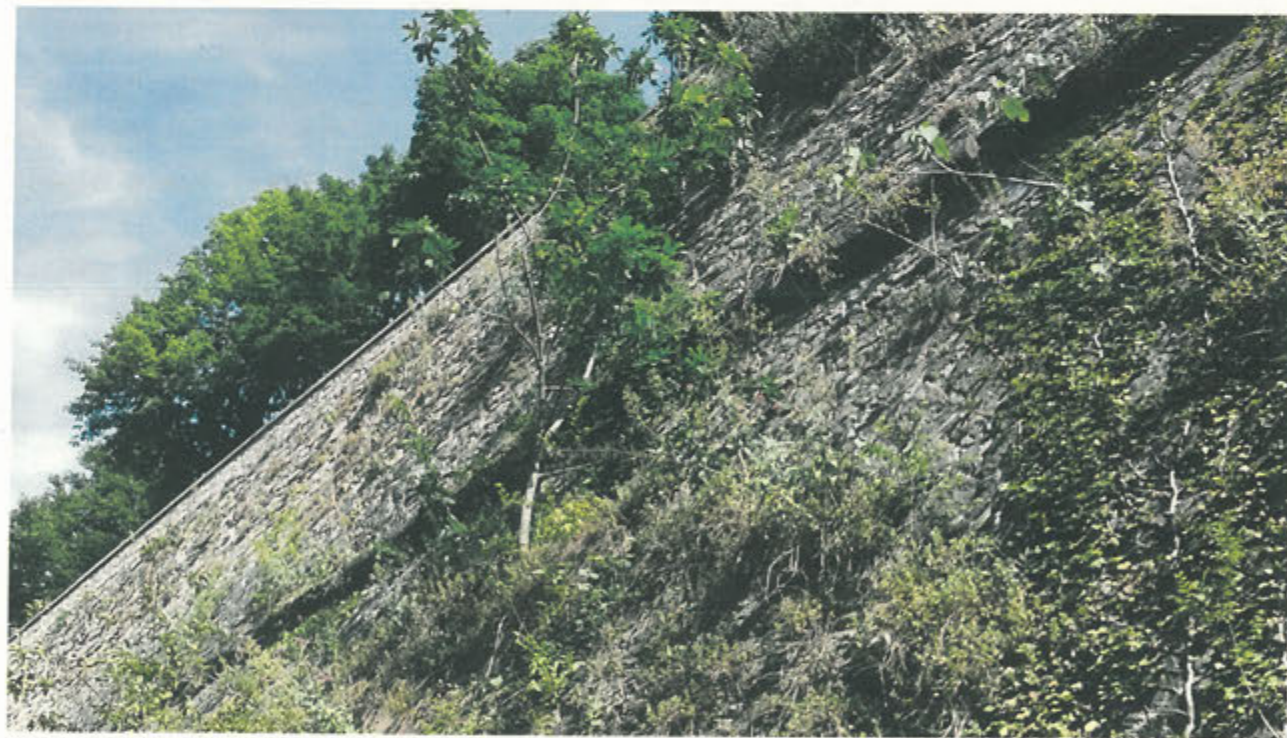
CORTINA DI S. ANDREA - prima