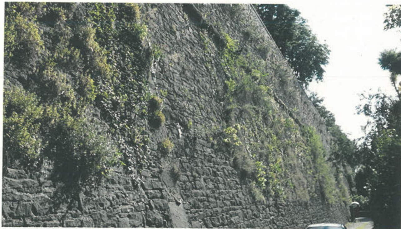
CORTINA DI S. ANDREA - prima