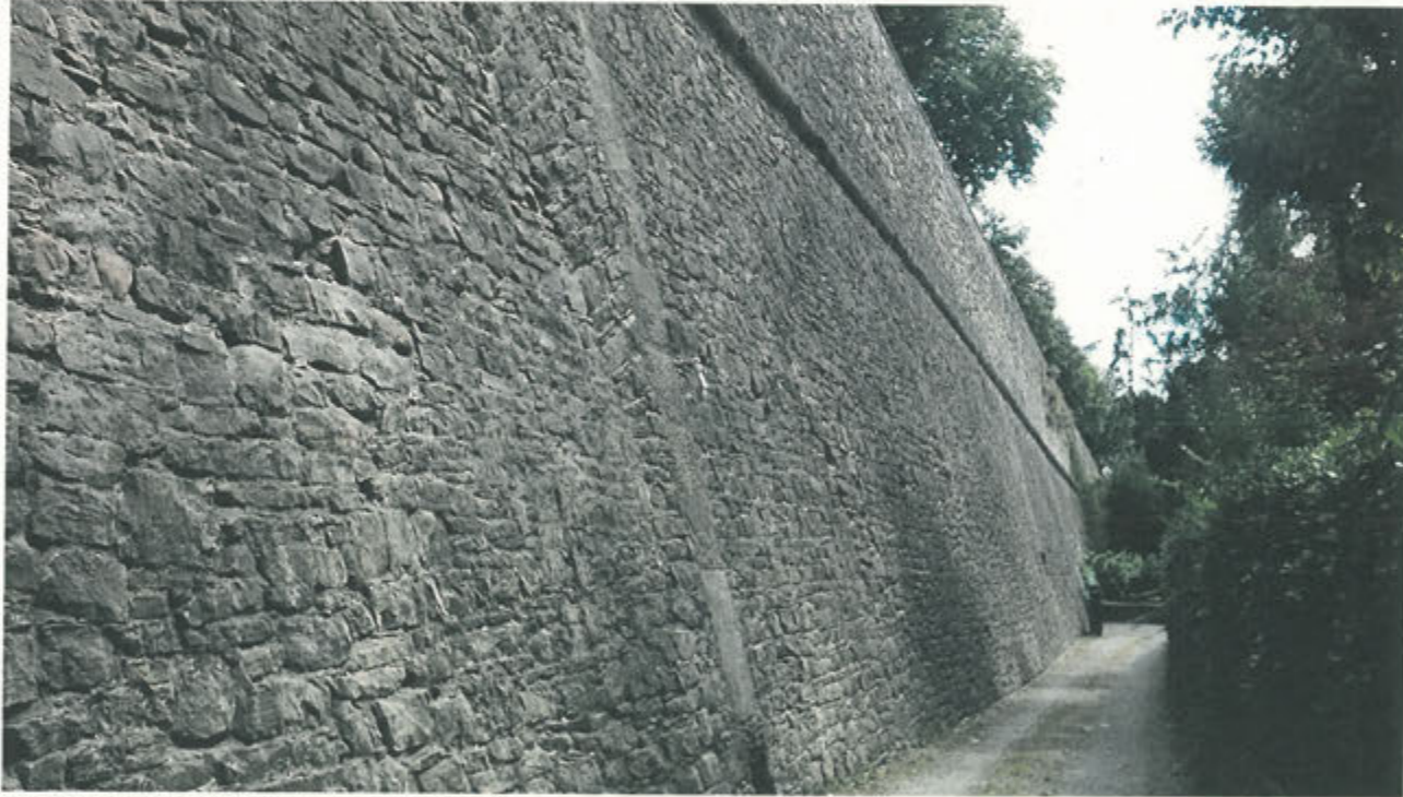
CORTINA DI S. ANDREA –lavori ultimati