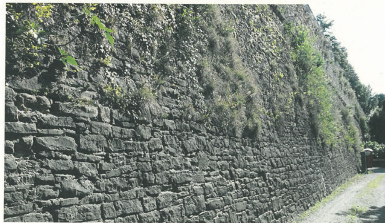
CORTINA DI S. ANDREA – lavaggio con idropulitrice dopo rimozione vegetazione parte bassa