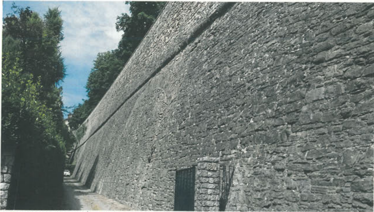
CORTINA DI S. ANDREA –lavori ultimati