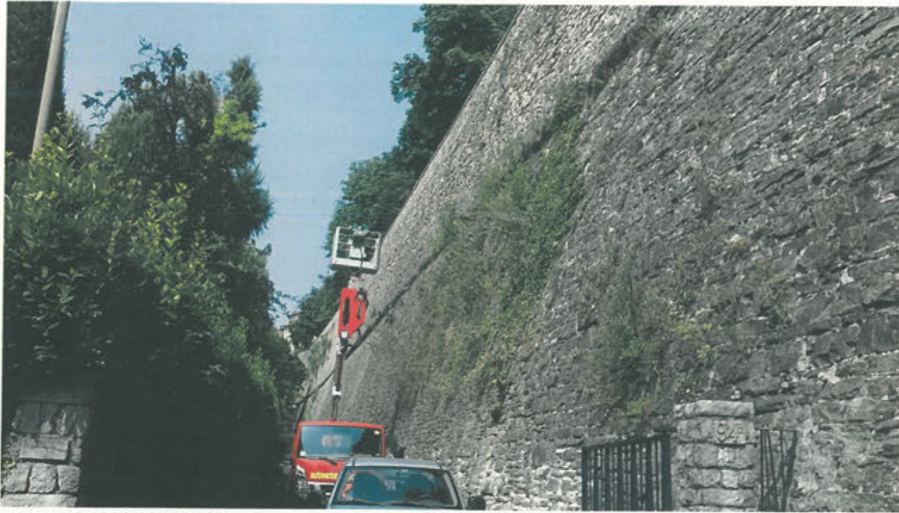
CORTINA DI S. ANDREA –rimozione vegetazione parte alta