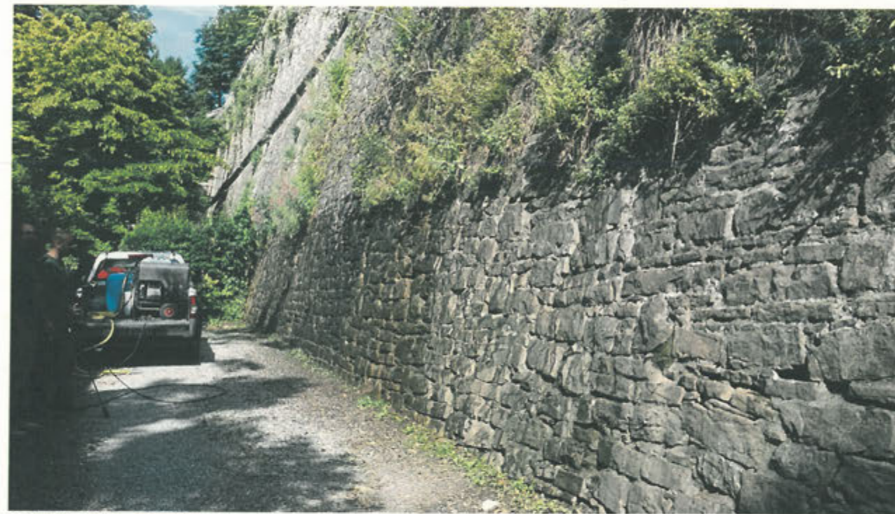
CORTINA DI S. ANDREA – lavaggio con idropulitrice dopo rimozione vegetazione parte bassa