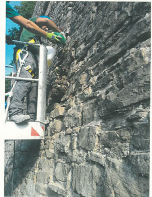
CORTINA DI S. ANDREA –trapanatura radici e inserimento diserbante