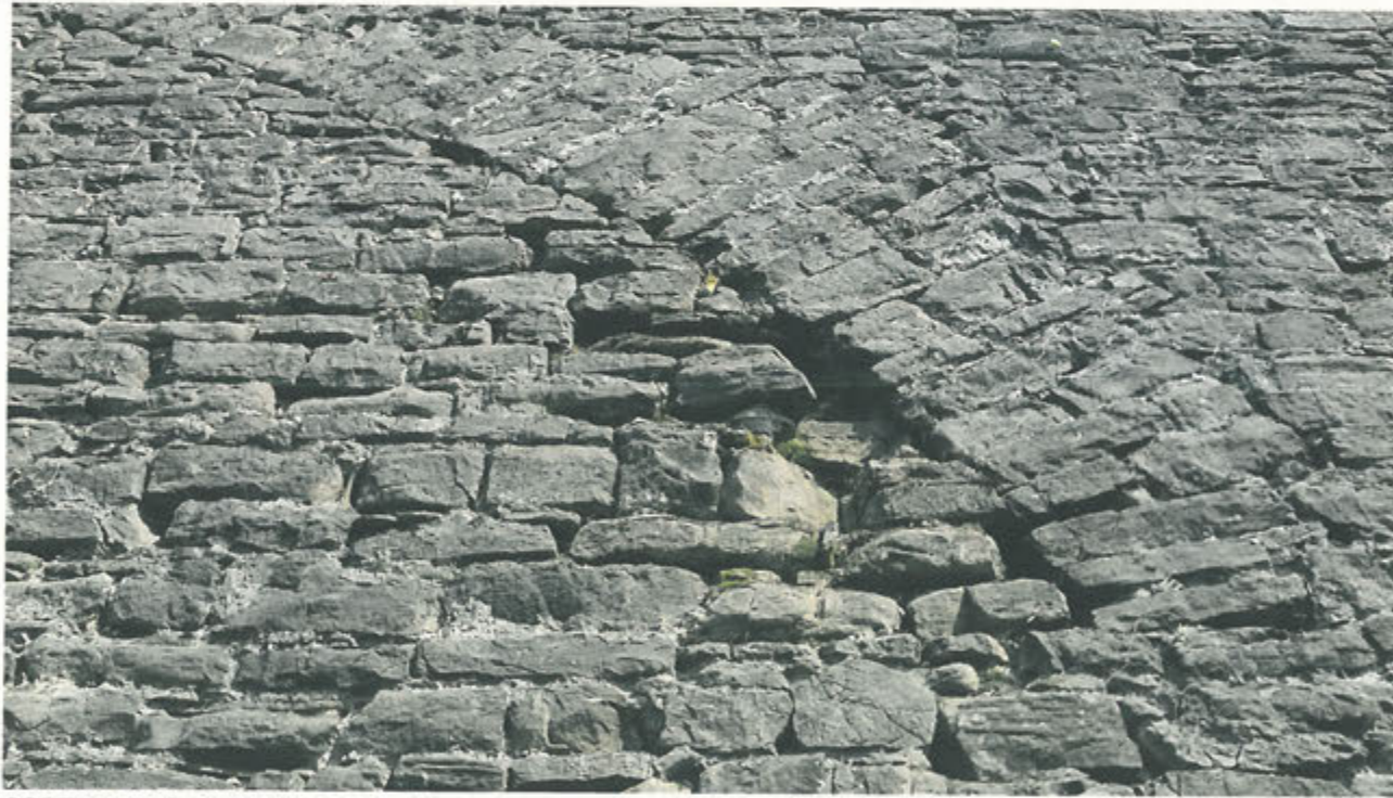
CORTINA DI S. ANDREA –particolare zona con mancanza conci di pietra