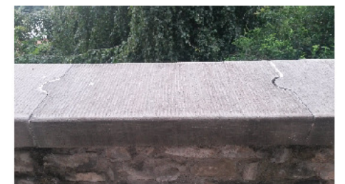
COPERTINA TIPO IN PIR RA ARRETRATA IN SARNICO